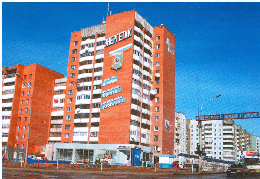
Братск — один из городов Иркутской области для реализации Госпрограммы